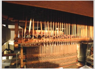
... für das Hauptwerk