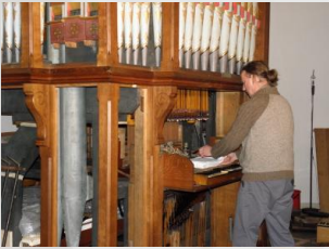
Einbau der Klaviaturen