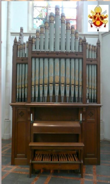
Walker-Organ 12/II+P (1886 | 2012)

- Festschrift zur Orgelweihe - am Palmsonntag, 1. April 2012 um 17 Uhr