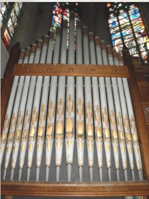
Farbliche Ausbesserung der Prospektpfeifen