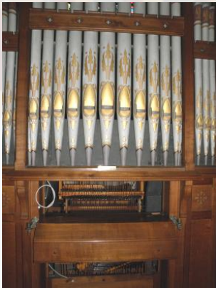
Versorgung der Orgel mit Strom