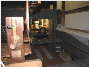
Einblick in die Mechanik...