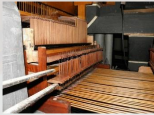
Einbau der Mechanik