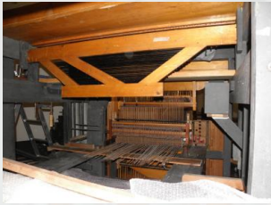
Einbau der Mechanik ...