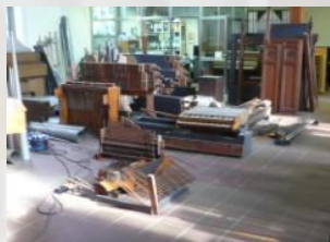
Bilder vom Abbau der Orgel in der Kirche der Firma Instrumente Ladach