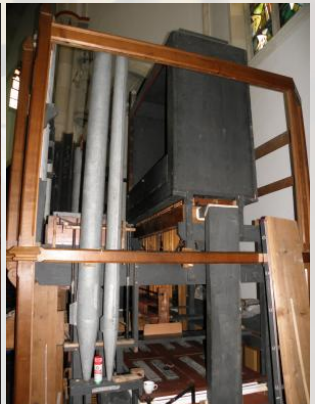
Einblick zum Schwellkasten