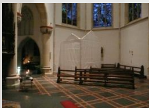
Größenmodell der Orgel zur optischen Vorstellung im südlichen Querschiff

Das Projekt „Walker-Organ 1886“ für die Basilika St. Ida in Herzfeld bedurfte einer langfristigen Planung und einer Vielzahl von Helfern und Ratgebern. Die folgende Bilderserie soll hier einen Überblick verschaffen: