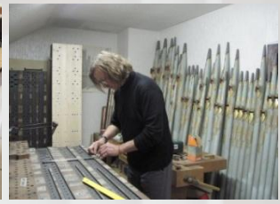
Währenddessen überarbeitete Orgelbau Klimke die Manuale und Windladen