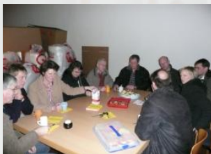
Besichtigung der Walker-Organ in der Trinitatiskirche zu Wuppertal bei Ladach