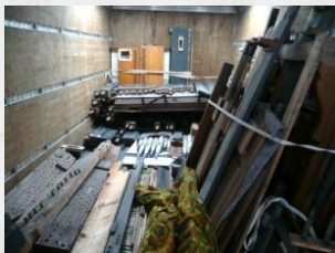
Lagerung und Transport im Lkw