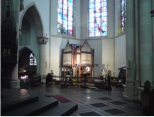
Einbau der Prospektpfeifen