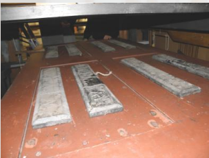
Gewichtung des Windbalgs