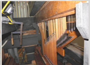
... für das Schwellwerk