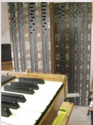
Tastatur und Windladen in der Werkstatt von Orgelbau Burkhard Klimke