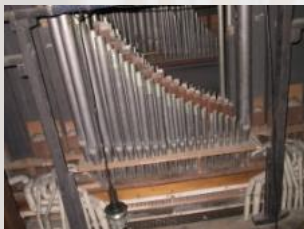
Bild vom Innenleben der Orgel vor dem Abbau